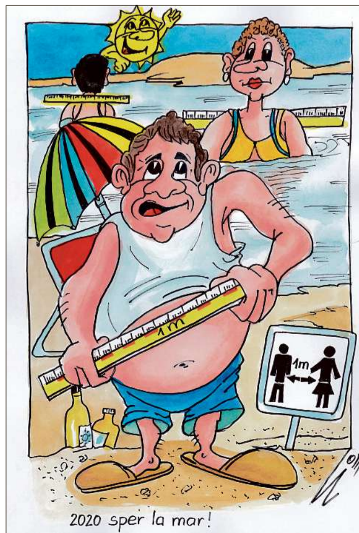
2020 sper la mar!