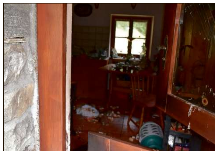
In'explosiun da gas ha mazzà ad Arvigo in um da 77 onns