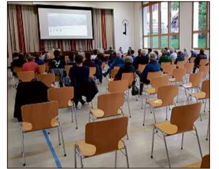
Igl basegn da discutir la fusiùn e pletost mudest.

da vendergis proxim. Sch'ign resu-mescha curtameing igls menis constatesch'ign ca blears s'expriman an favur da la fusiùn, mo igl para ear egn bün tant c' à resalvas perveia digl prozeder a la preascha. Nus vagn fatg tres amparadas a parsünas contactadas savund igl prinzipi da la casualitad.