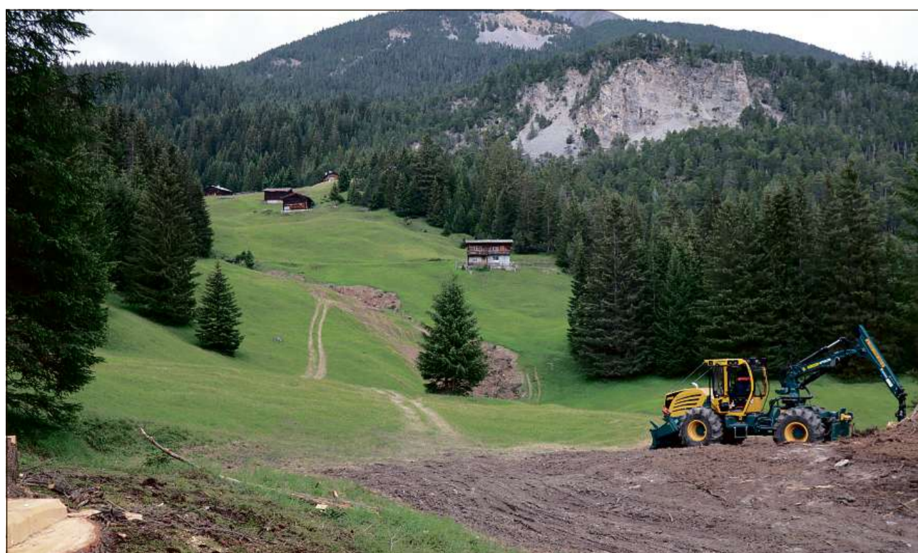
Sen las aclas da Propissi èn las maschinis gio ved la lavour. Per part èn neidas taradas plantas per lung dallas lengias viglias.

Or digl mez digl cumegn ins ò er lia saveir tge interpresa tgi seia neida incumbensada cun las lavours. Igl mastral ò communigia tgi chegl seia la firma Pirovino da Le Prese. Ins vegia pero nignas lètgas cun la surdada essend tgi las lavours stettan sot la lescha da submissiu e tenor chella ins vegia da surlascher las lavours all'offerta la pi bungmartgeda.