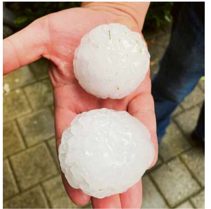
Betg ballas da tennis, mobain granella ch'è vegnida giu da tshiel ed ha fatg donnuns.