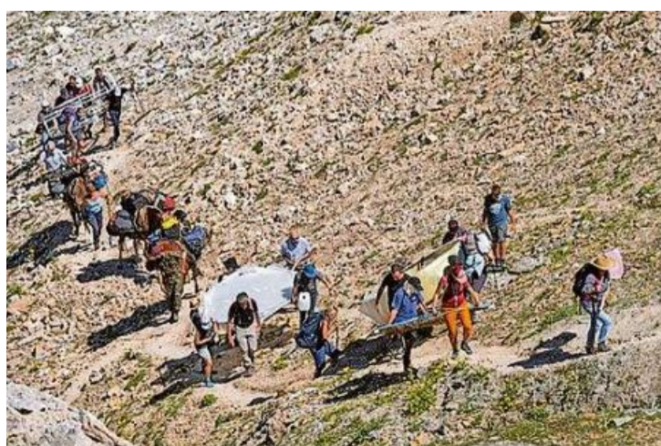
Ena caravana da radond 40 persungas ò purto l'oura demontada an differenta toca alla Fuorcla digl Leget.

Per igl transport dall'oura cun en diameter da 2 meters ins ò demonto las singulas parts. Ena caravana ò purto chellas dalla veia digl pass anfignen tar igl crepel marcant. Mano dalla societad