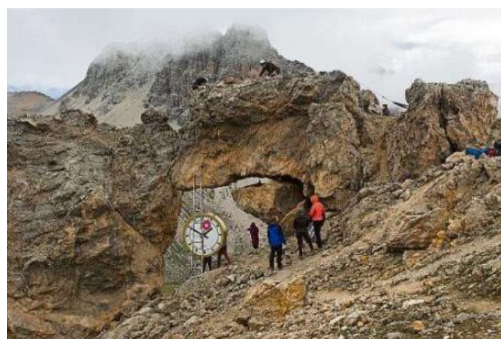
Per la montascha dall'oura ègl duvro ena tecnica da souas speciala.

Per demontar l'oura è previa en proceder sumigliant. «Igl amprem vaina da piglier dapart l'oura puspe an differentes tocs ed alloura duvrainsa puspe gidanters e voluntaris. La societad digl train ò gio do a pled tgi els seian puspe dalla parteida», deian igls artists. L'idea fiss, da pudeir exponer igl object ainten differentas exposiziuns d'art an Svizra e Tera tudestga ansemen cun en pitschen film tgi mossa igl svilup dall'oura. Ella vegia naturalmaintg en istorgia ed aura, essend stada integrada ainten en tal li special e percheigl fissigl lour givaisch, da pudeir cuntinuar cun igl project, uscheia igls artists.