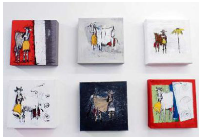
Vreni Netzer malegia vatgas en tuttas dimensiuns.