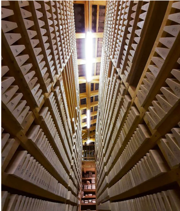
Il lain da resonanza s'empluna en il magasin a Latsch – qua in cuc tranter las curunas cun lain da resonanza per gias.