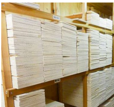
Lain da Master (MA), quai vul dir da la pli auta qualitat areguard regularitad, finezza dals rints annuals e color.

newood Switzerland elavura è dentant almain in pau pli speziala. Mintga pign n'è numnadamain betg adattà, uschia l'expert: «La planta ideala è guliva ed ha be pauca roma. Plinavant sto ella avair rints annuals stretgs, pia sto il pign esser creschi plaun.» Tar la tscherna dals pigns vai pia per ina buna struttura dal lain. Quella disturbassan per exempel chatschs da roma e consequentamain fiss la resonanza mendra.