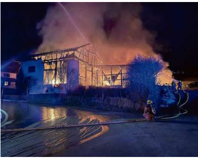
Glindesdi è rut ora in incendi en ina stalla a Riom.