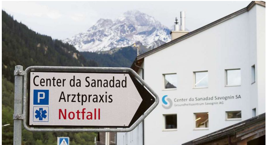
Il Center da Sanadad Savognin cumbatta dapi onns cun problems finanzials, po dentant quintar cun il sustegn dal Cumeegn Surses e da la populaziun.