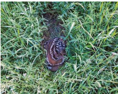
I dovra buns eglis ubain ina buna drona per chattar ils ansiels en il pastg aut.