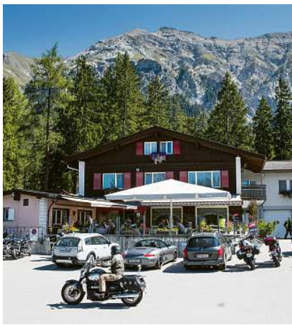
Tar il campadi s. Cassian a Lantsch tutga era in'ustaria.