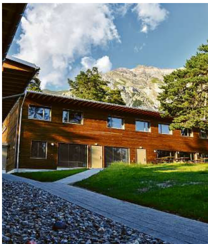
La chasa da vacanzas Don Bosco è da nov ina firma da partenari dal Parc Ela.

Tut en tut ha il Parc Ela actualmain 24 firmas da partenari, sajan quai hotels, gastronomia, artisanadi ed agricultura. (cdm/fmr)