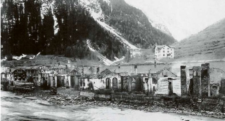
Üna vista sül quartier da Susch cha'l fö ha desdrüt avant 100 ons.