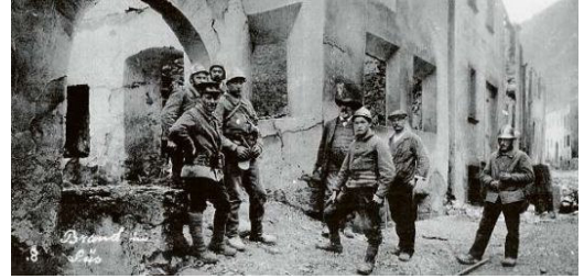
Il sumpiers davo l'incendi illas ruinas da Susch.