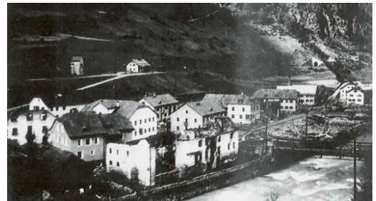
Il cumün da Susch d'ürant la refabrizaziun e cun las prümas chasas sbodadas.