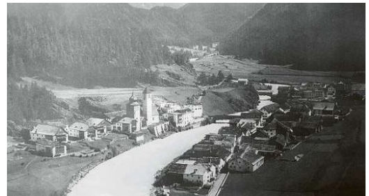
Üna vista sün Susch avant l'incendi dals 19 avrigl 1925. Giosom a schneistra as rechatta il quartier brüschà.